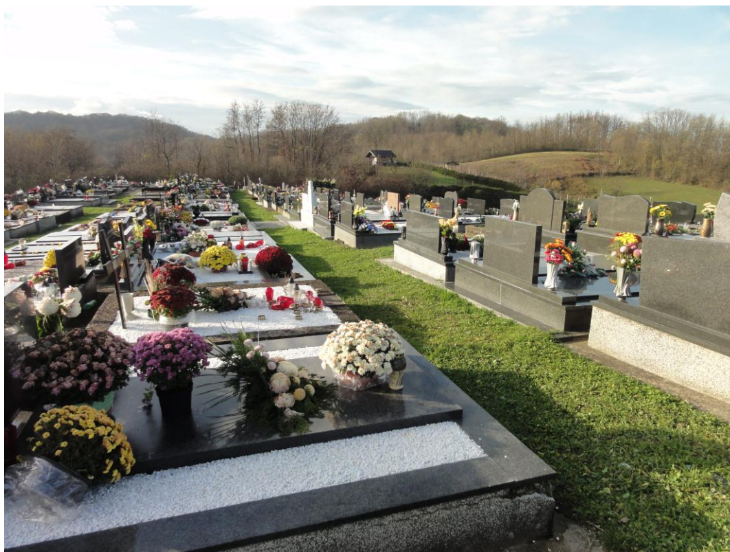
Prikaz novijeg dijela groblja polje III i III/A– pogled prema zapadu

Prema snimci postojećeg stanja, na postojećem dijelu groblja, što znači u sklopu navedenih četiriju grobnih polja (polje I, polje II, polje III i polje III/ A), izvedena su grobna mjesta za zemljani ukop, kod čega je evidentirano oko 1150 grobnih mjesta s pretežito dvostrukim grobovima (tip Z2) i malim brojem jednostrukih grobova (tip Z1).